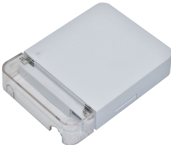
Рисунок 1 - Общий вид